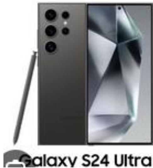
Galaxy S24 Ultra

162.30 x 79.00 x 8.60 mm, 232g, IP68 olorowy / Dynamic AMOLED 2X 16,7M kolorów, 120 Hz 1440 x 3120 px (6.80") 505 ppi ~88.5% screen-to-body ratio Corning Gorilla Glass Victus 3 Bateria Li-Po 5000 mAh Pamięć 12/256GB, USB Power Delivery do 45W Android 14 One UI 6.1 Qualcomm Snapdragon 8 Gen 3 SM8650 Zegar procesora: 3.39 GHz Liczba rdzeni: 8, GPU: Adreno 750 Aparat 200/12/50/10 Mpix, przód 12Mpix Czujniki akcelerometr, światła, grawitacyjny, barometr, magnetometr. GPSx5, NFC, czytnik linii papilarnych, żyroskop, efektu Halla Kolor czarny, szary, fiolet, żółty